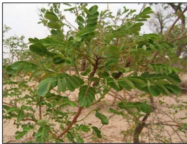
103. Cassia senna L. (Caesalpiniaceae)