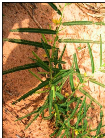
100. Cassia mimosoides L. (Caesalpiniaceae)